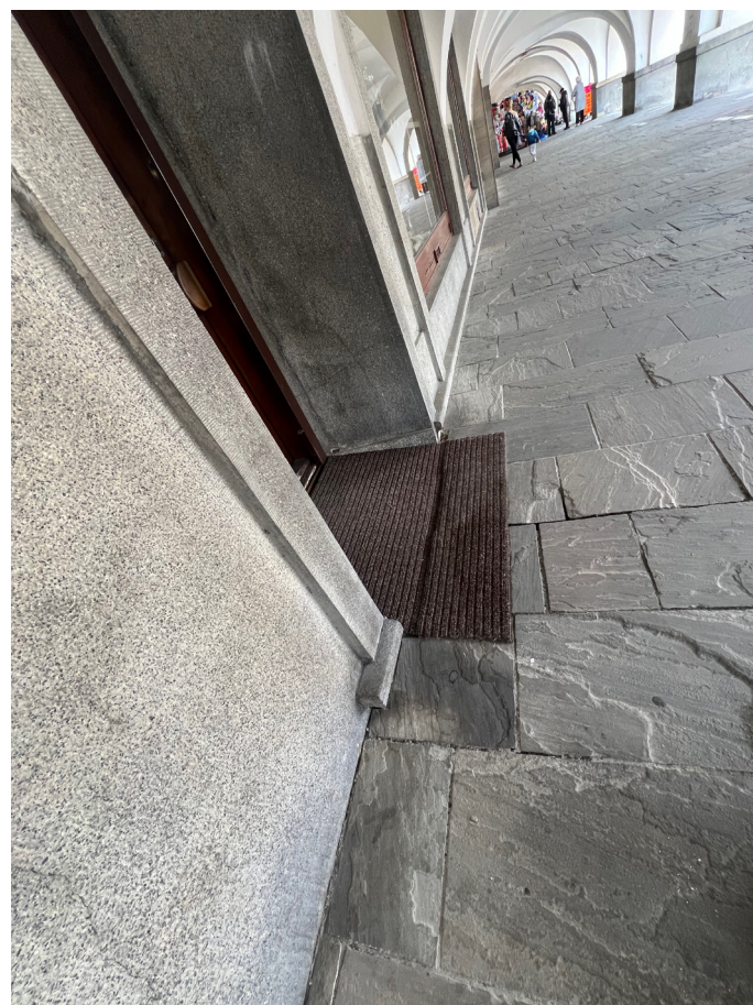
Obr. 11-14: Dochovaný stav památky