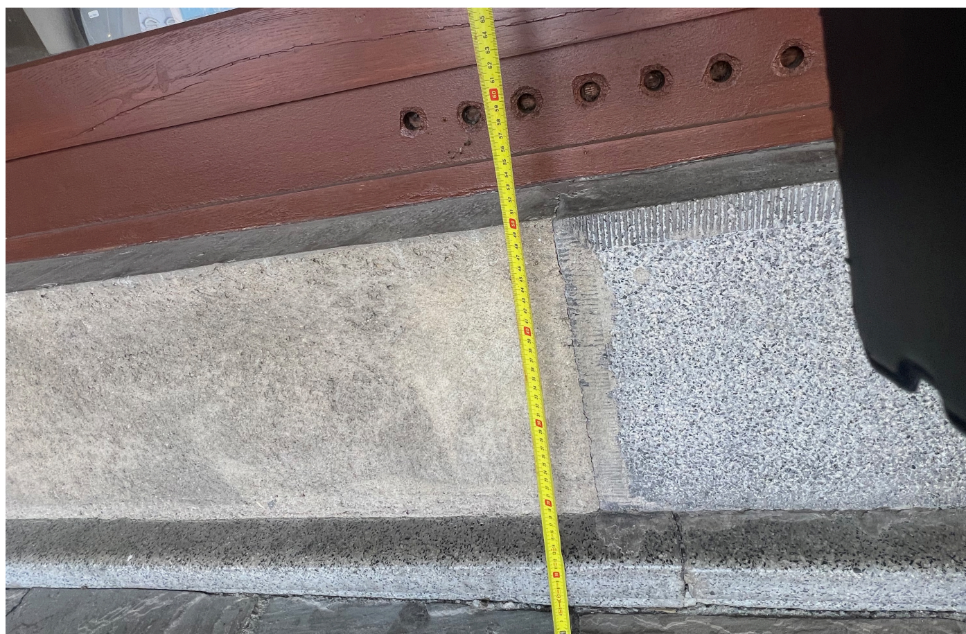
Obr. 15 - 16 Dochovaný stav