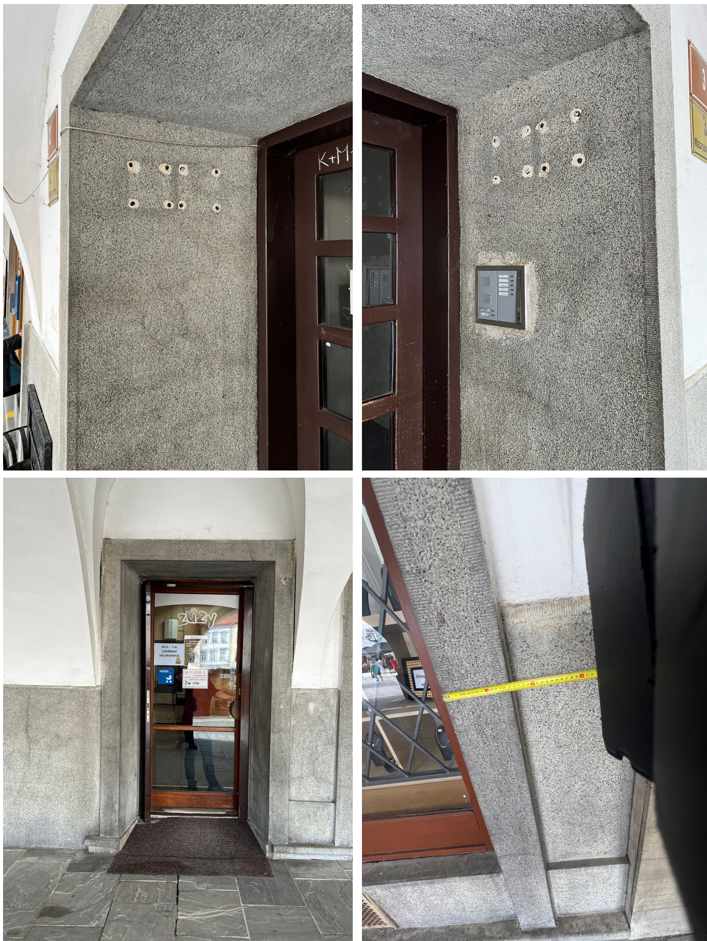
Obr. 5-8: Dochovaný stav památky