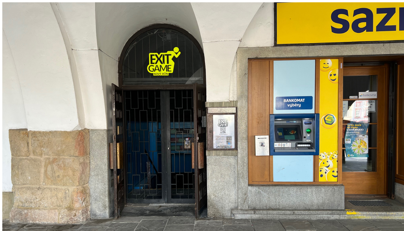
Obr. 1-2: Dochovaný stav památky