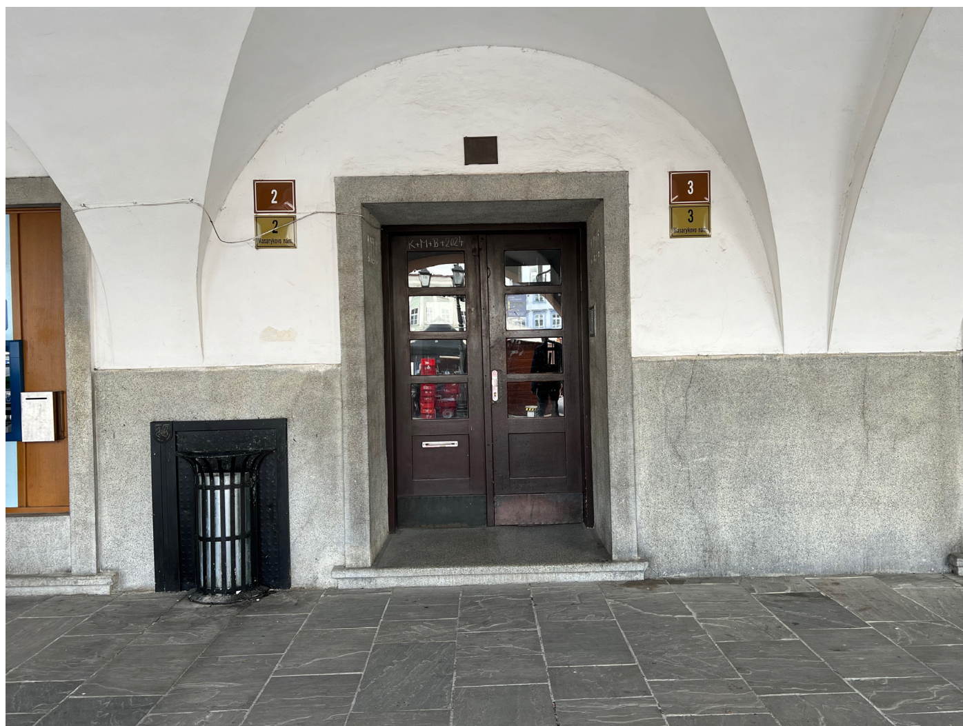
Obr. 3 - 4 Dochovaný stav památky