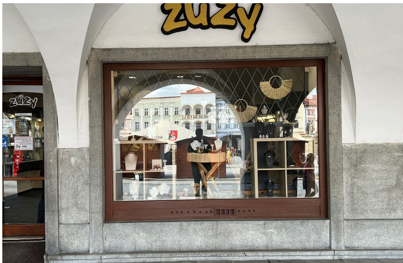
Obr. 9 - 10 Dochovaný stav