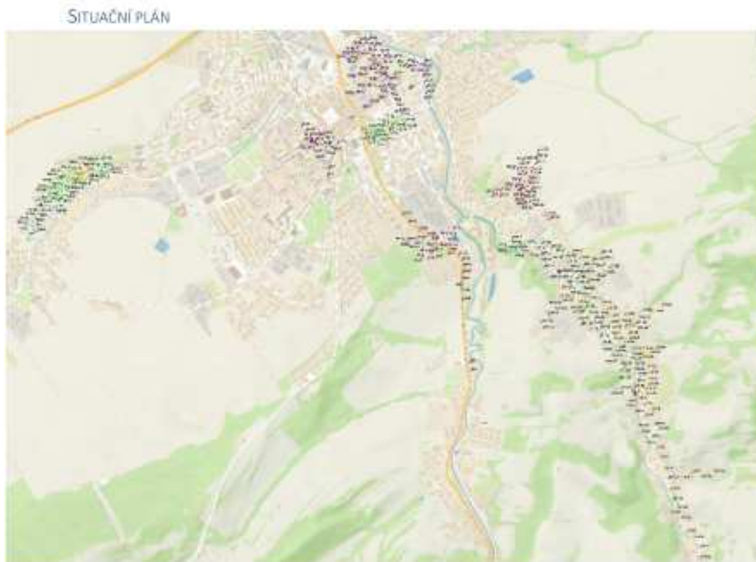
Pro obsáhlost vložen pouze náhled

Účastník podpisem níže stvrzuje, že se seznámil s touto přílohou.