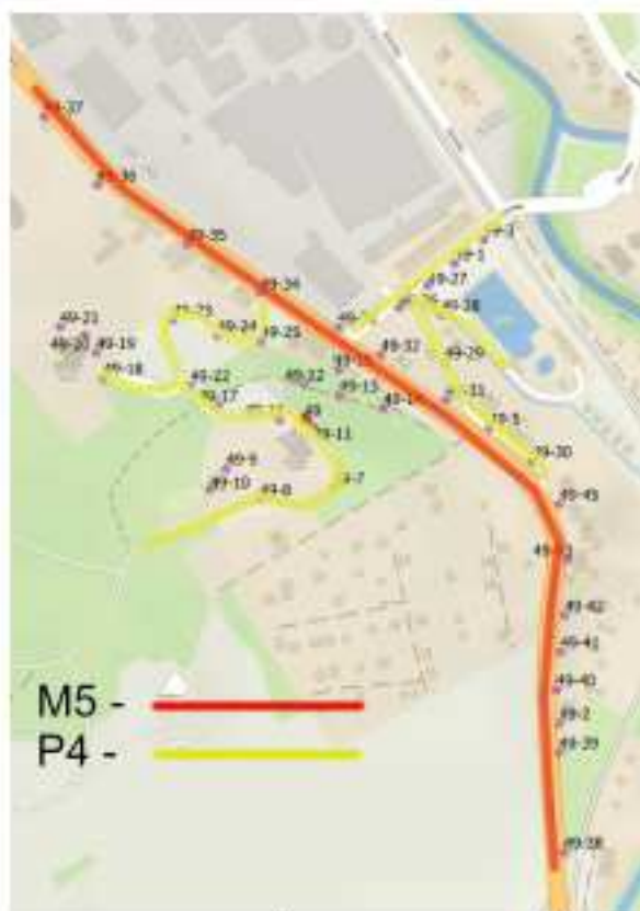
Zatřídění komunikací dle ČSN CEN/TR 13201-1 „Revoluční“