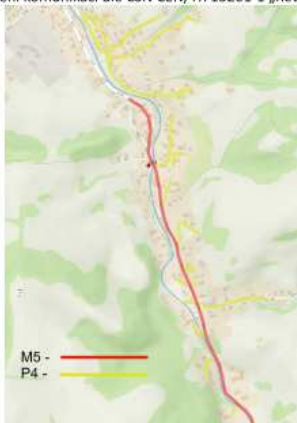
Zatřídění komunikací dle ČSN CEN/TR 13201-1 „Žilina“