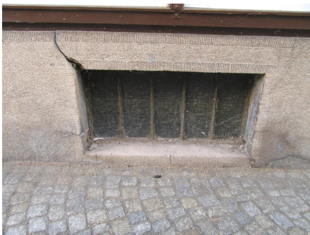
Praskliny jsou na více místech fasády