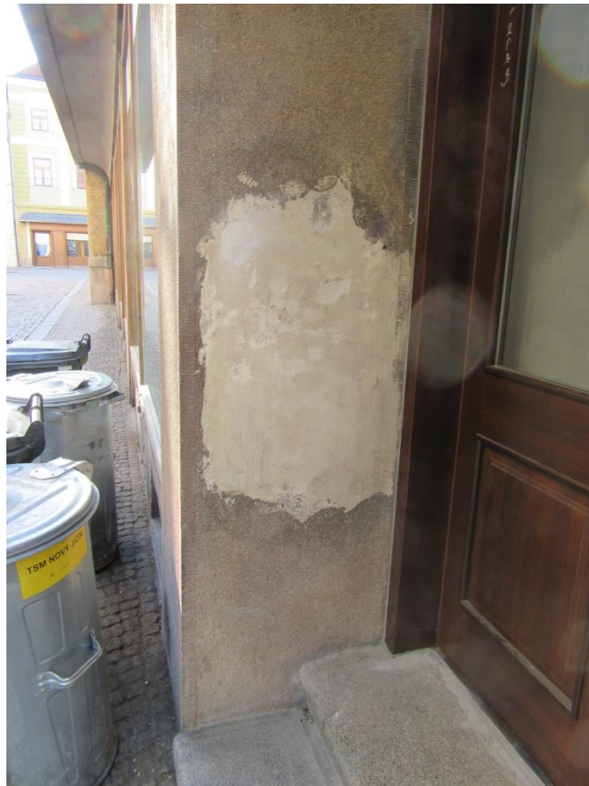
Dozdění omítkou místo teracca