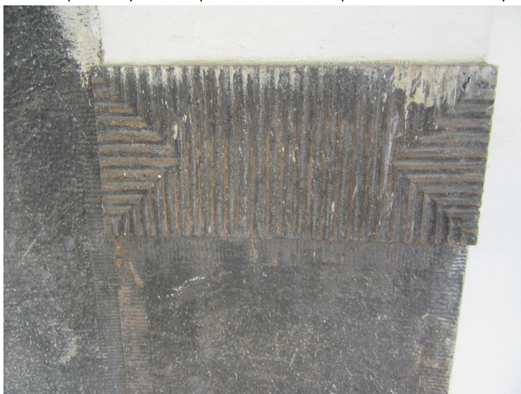
Dekoratívny prvky fasády