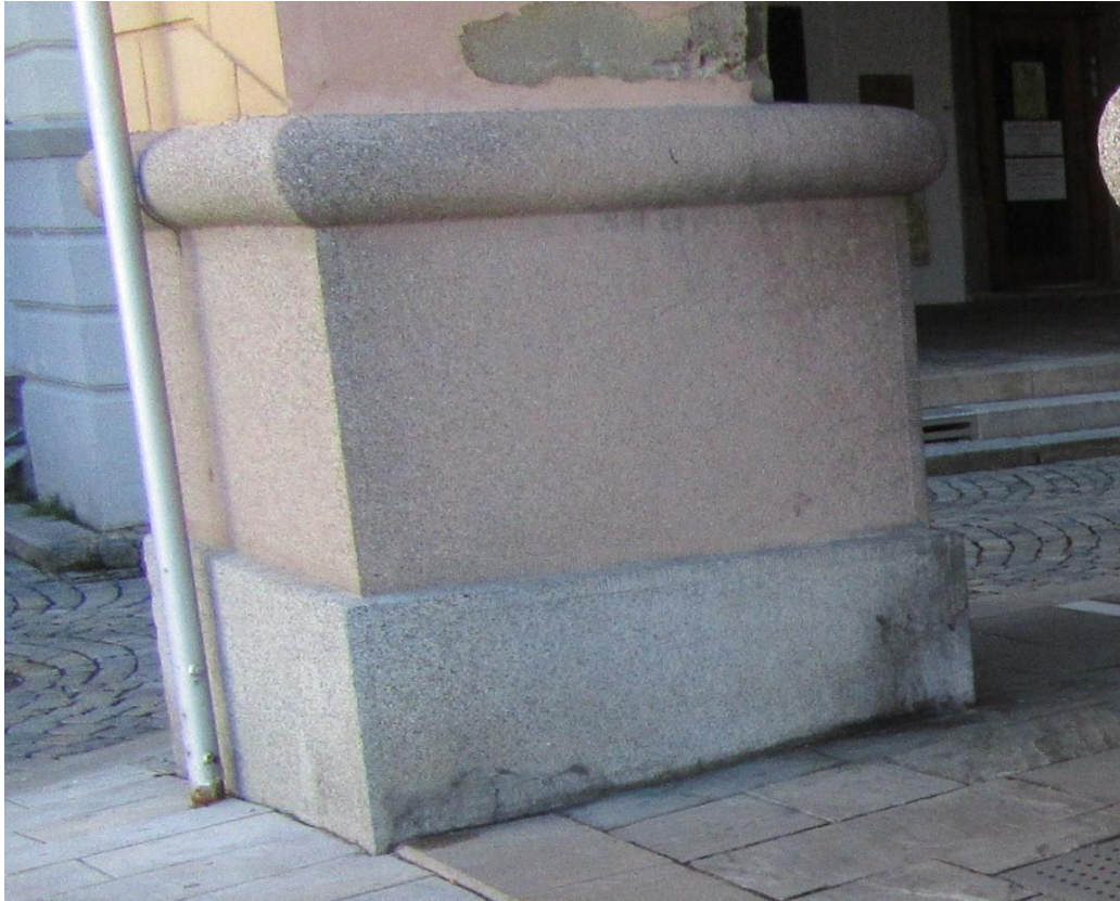
Praskliny na soklech podloubí