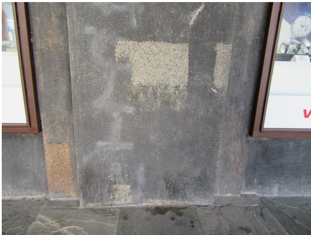
Ukázka provedených vzorků po očištění – doložení původní barevnosti fasády