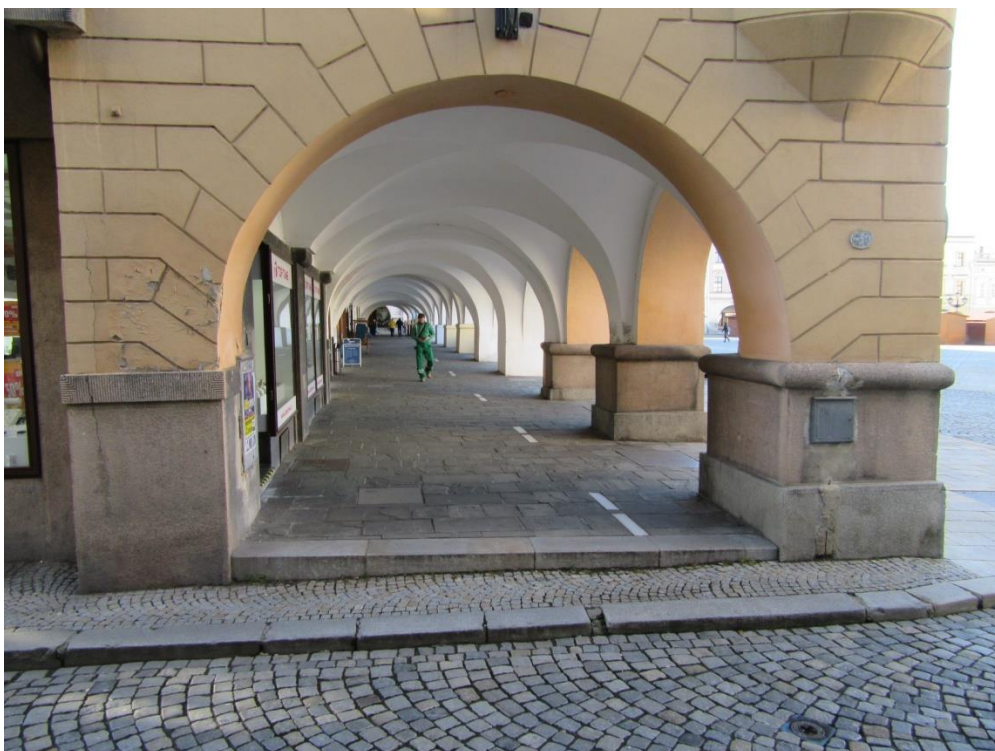
Pohled na posuzovanou stavbu – roh Masarykova náměstí č.23 a Dobrovského č.2 ( Pohled z ul. Dobrovského )