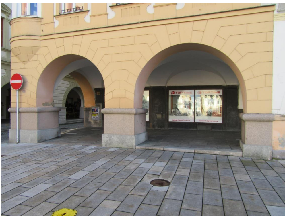
Pohled na posuzovanou stavbu – roh Masarykova náměstí č. 23 ( V pohledu teracové patky, v loubí teracová fasáda)