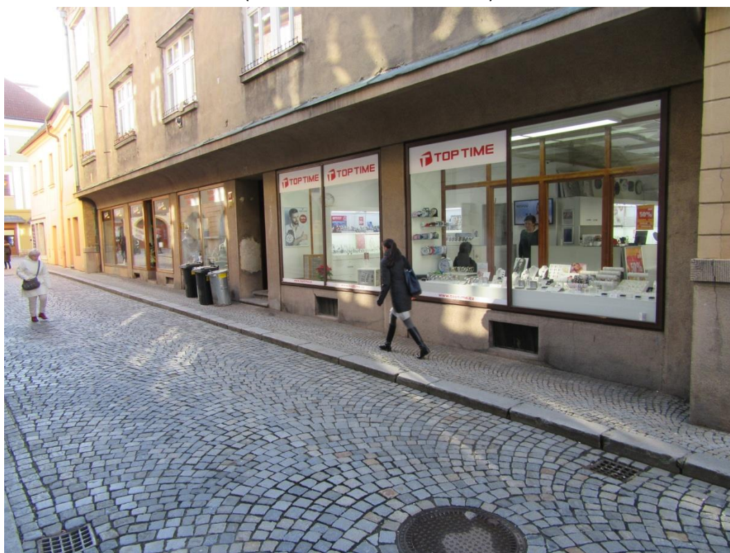
Pohled na posuzovanou stavbu – ul. Dobrovského č.2( Teraccová fasáda )