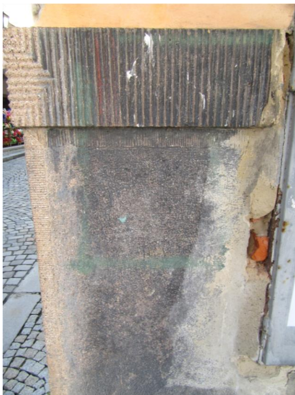
Znečištění barvami (vlevo očištěn vzorek barevnosti dekoru a lem