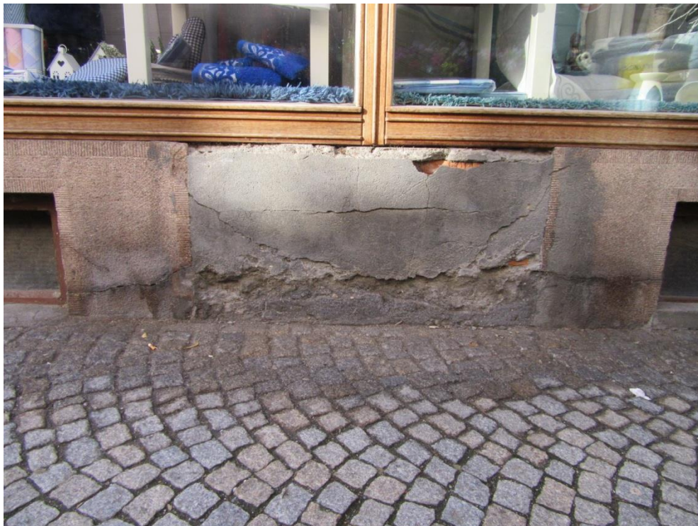
Dozdění omítkou místo teracca