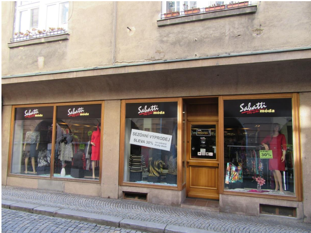
Pohled na posuzovanou stavbu – ul. Dobrovského č.2 ( Teraccová fasáda – zaoblení vrchního pohledu )

Dokumentace zašpinění, poškozených částí fasády apod.