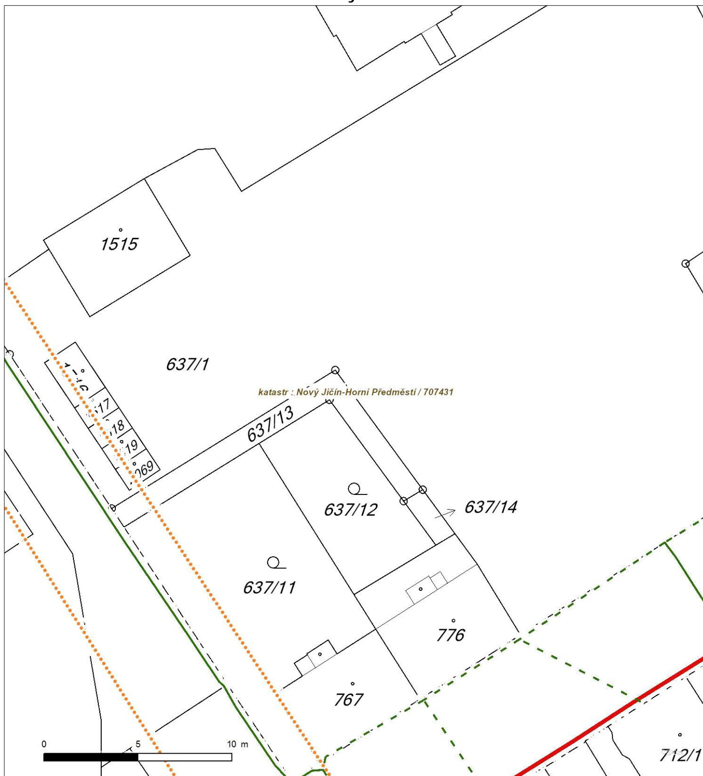
Situa ní výkres - list 3

Není-li zobrazena katastrální mapa, zadejte žádost znovu. Katastrální mapa je generována prostřednictvím externí WMS služby, jejíž provoz nezajišťuje společnost EZ Distribuce, a. s.